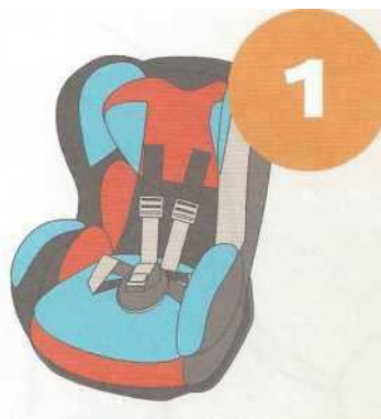
9-18 кг от 9 месяцев до 4 лет