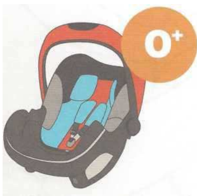
0-13 кг от рождения до 1 года

Покупайте кресло вместе с ребенком. Пусть он попробует посидеть в нем - прямо в магазине.