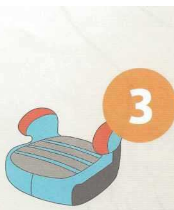
22-36 кг от 6 до 12 лет