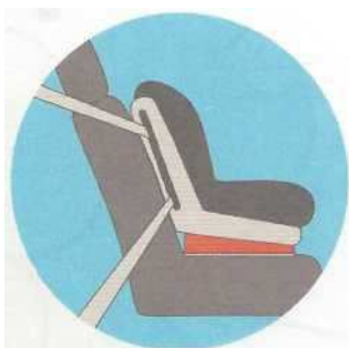
Лицом по ходу движения

Самое безопасное место для установки детского кресла в автомобиле — среднее место на заднем сиденье. Самое небезопасное - переднее пассажирское сиденье. Туда автокресло ставится в крайнем случае, при обязательно отключенной подушке безопасности.