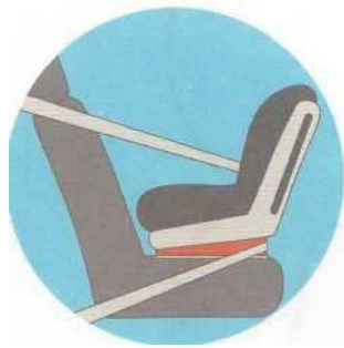
Лицом против движения