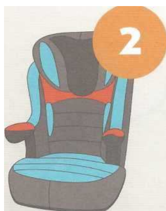
15-25 кг от 3 до 7 лет